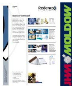
Sortiment fra Redenco

Redenco ApS er et datterselskab af JHM-Moldow A/S