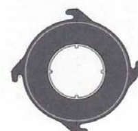
Flance 4 lug