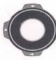
Flance 3 nøgler