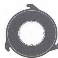
Flance 3 lug