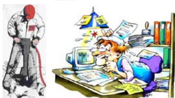
Luft hastigheden omregnes