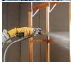
Bæreevnen og filterforbrug