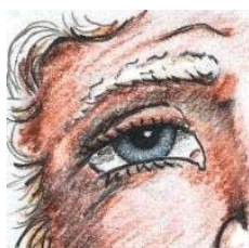
Måske det vigtigste afsnit

Når et filtermedie er blevet klassificeret efter EN 779:2002, får det betegnelsen G for et grovfilter eller F for et finfilter. Der indfanges partikler efter en given norm og efterfølgende optælles partikelstørrelsen 0,4 µm. Det vil sige, at opfanger filtermediet: