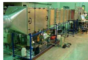
Prøvestand i følge DIN EN779:2002.

• Filtervalget er dit! Redenco tilbyder en håndsækning til din opgave.