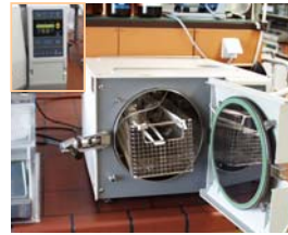
Autoklave Tuttnaver 2540 EL

Prøveposerne, som er lavprisprodukter fra Asien og det sydlige Europa. De ser ud til at ligne BWF kvalitet ved første øjekast. Analysen i laboratoriet, især hydrolyse testen , viser alvorlige ulemper.