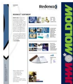
Sortiment fra Redenco

Vi tror på: Ikke kun data på papiret skal have indflydelse på valget af kvaliteten, men også en pålidelig leverandør hjælper med til at undgå en dårlig oplevelse.