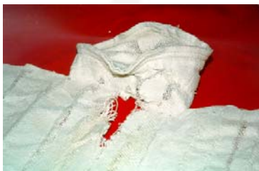
Ødelagt polyesterpose af vand

Resultatet bliver en utilfredsstillende kort levetid på filtreposerne.