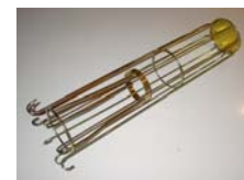
Kurv og et tilfældigt udsnit af en bund